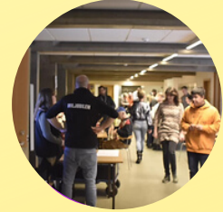
Miljømesse Meget mere end skrald STADEHOLDER