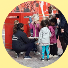
Meyers Madfest MADBODER