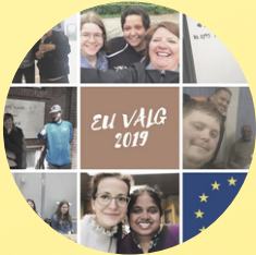
Europa Parlamentsvalget VALG- TILFORORDNEDE