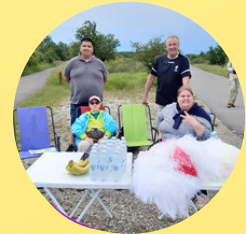
Tour De Amager RUTEVEJLEDERE