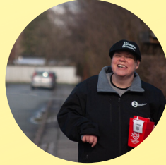
Landsindsamling Folkekirkens Nødhjælp PENGEINDSAMLING