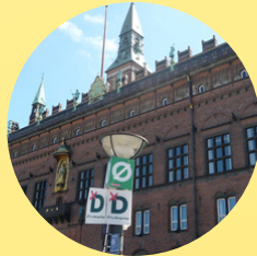
Folketingsvalget VALG- TILFORORDNEDE