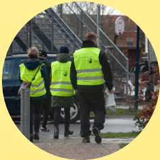
En Gåtur Langs Kysten SKRALDEINDSAMLING