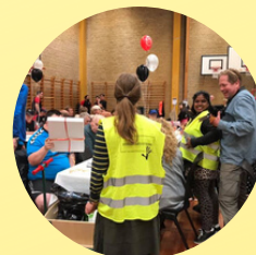
Idrætsdagen KIFU OPPYNTNING / SALG