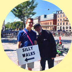
Silly Walks Parade CPH RUTEVEJLEDERE