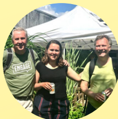
Jazz i Haven OPRYDNING