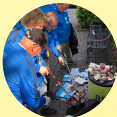
Copenhagen Marathon SKRALDEINDSAMLING