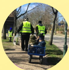
Affaldsindsamlingen Danmarks Naturfredningsforening SKRALDEINDSAMLING