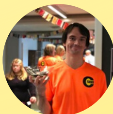
Københavnferfesten TJEK IN