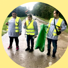
Ungdommens Folkemøde SKRALDEINDSAMLING / AD HOC I FRIVILLIGOMRÅDE