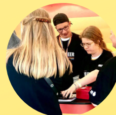
Copenhagen Pride SALG / SKRALDEINDSAMLING