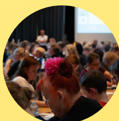
Banko TJEK AF PLADER / UDDELING AF PRÆMIER